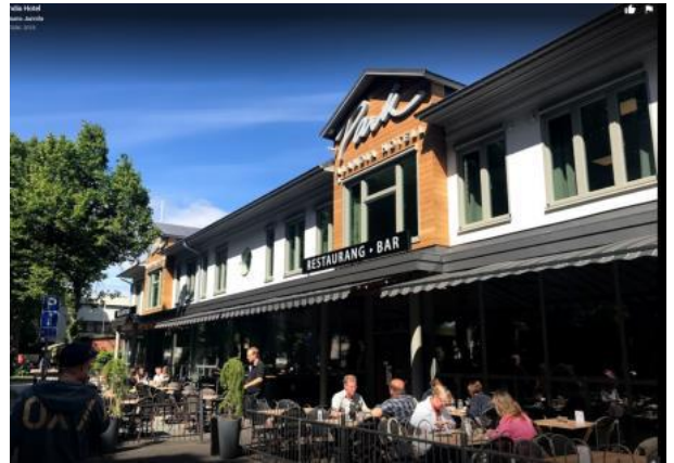
Park Alandia -hotelli Maarianhaminassa